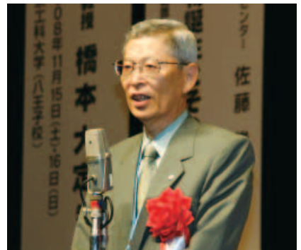
第28回日本レーザー医学会総会を主催 (2007年9月)