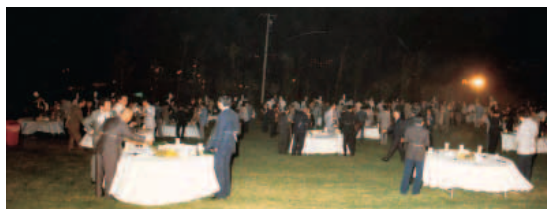
第19回日本移植学会総会懇親会（優佳良織工芸館） （1984年9月）