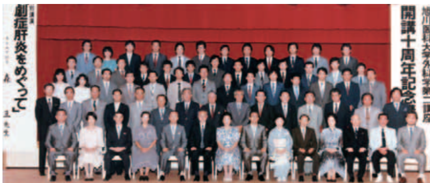
開講10周年記念祝賀会（1985年8月）