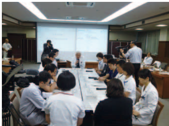
旭川医科大学 院内臓器提供シミュレーション (2013年)