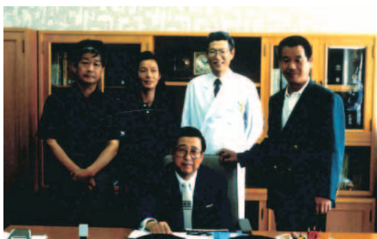
水戸迪郎教授，病院長就任（1991年8月）