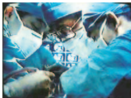
手術執刀中の水戸教授