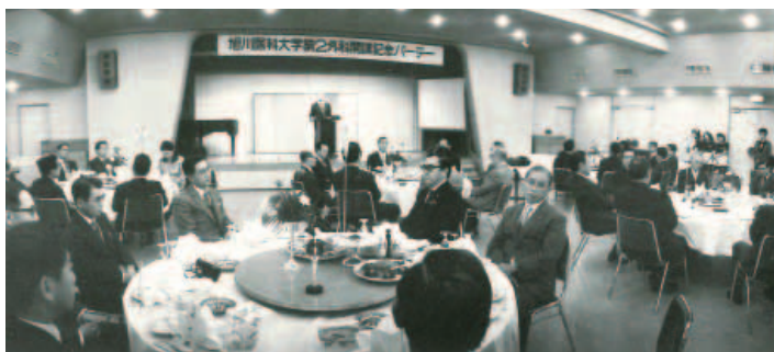
旭川医科大学外科学第二講座 開講記念祝賀会 （1976年10月）