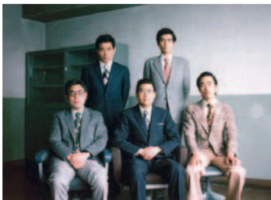
教室創立時教官（1975年4月）