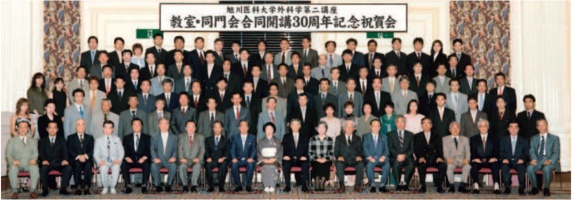
開講30周年記念祝賀会 (2004年5月)