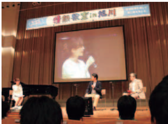
情熱教室 in 旭川2012 (2012年)