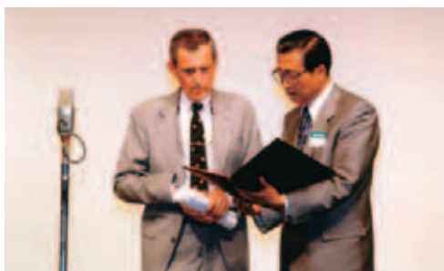
第30回日本肝臓学会特別講演 Thomas E. Starzl 先生