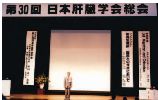
第30回日本肝臓学会総会を主催(1994年7月)