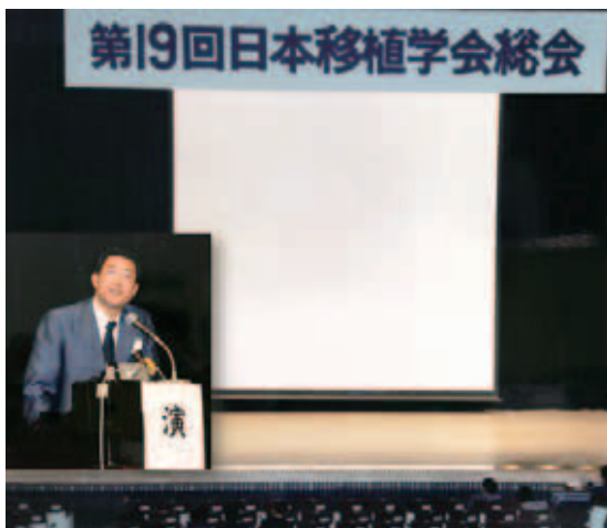
第19回日本移植学会総会を主催（1984年9月）