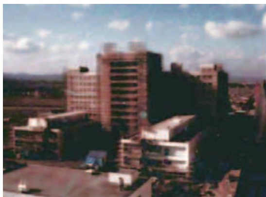
建設中の大学病院