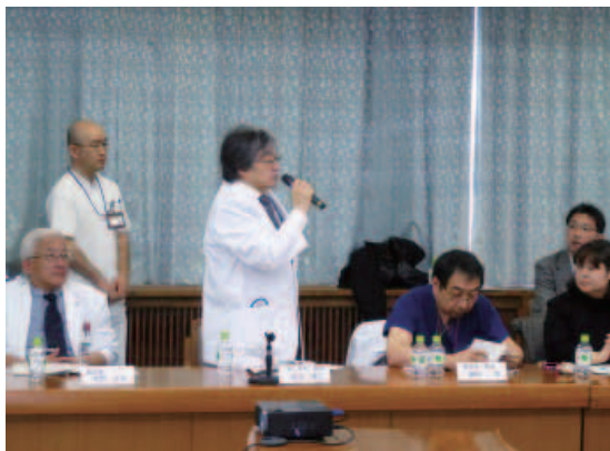
旭川医科大学 院内臓器提供シミュレーション (2013年)